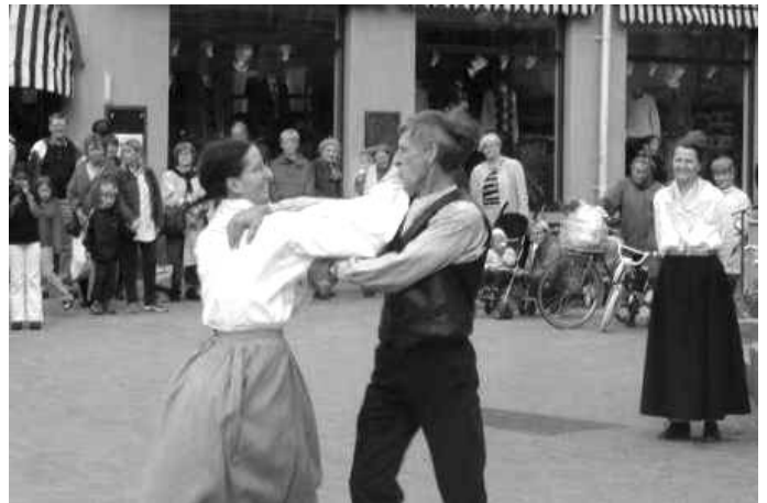
Björkstalaget fyller 80 år! Dansare ur laget ska lära ut folkdans 1 november. Här dansar de på en föreställning i Umeå.