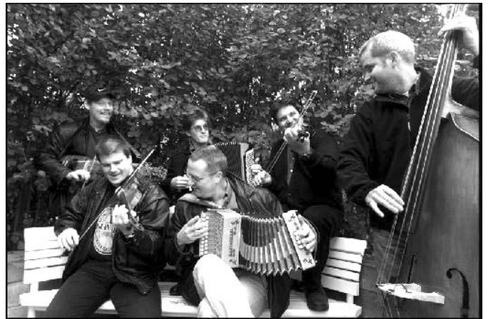
Twärdrag ska spela för oss den 1 november. Ser du den gemensamme medlemmen med Bordunverkstan? Bild från hemsidan.