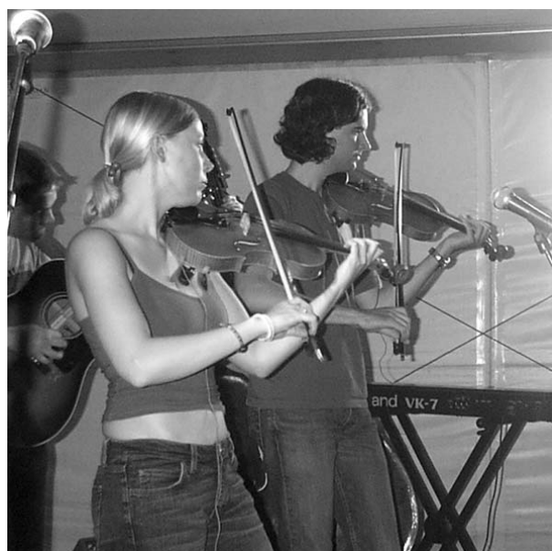
Två medlemmar ur norsk-finska Frigg, som även spelade i Umeå i februari. De var utvalda till årets grupp i Kaustby.