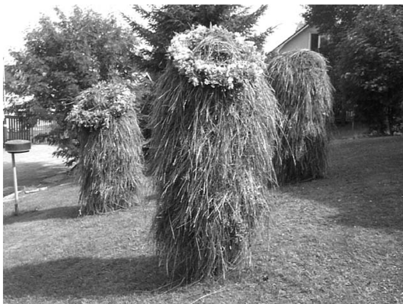
På Kaustbyfestivalen gjorde man typiska små finska hässjor av hö. För att det var fest, dekorerades de med blomsterkransar.

Har du övriga motioner till årsmötet, skicka dem skriftligt eller per mejl senast en vecka före mötet till ordföranden, kontaktuppgifter finns på sidan 2.