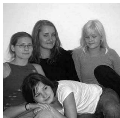
Här är Kraja, fyra unga umetjejer som har gjort en otroligt spännande musikforskarresa.