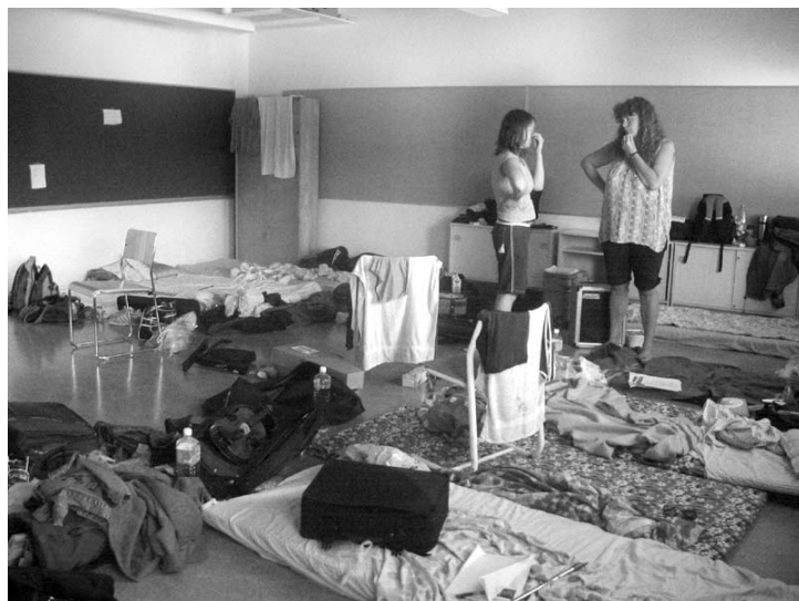
Masslogi i klassrum har sina sidor...!

Strul med elektroniken och en och annan mänsklig faktor gör att det finns för lite Kaustinenbilder i tidningen! Fler utlovas i nästa nummer.