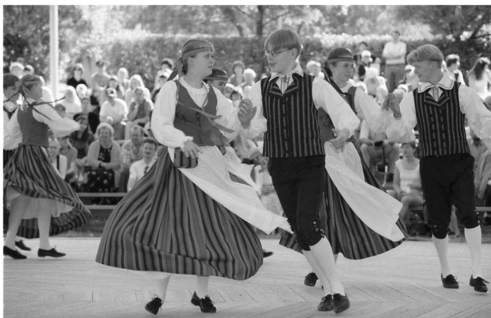
En av de många finska folkdanslagen av ungdomar, som alla gör fina scenprogram av hög klass. Och de ser ut att njuta av det!