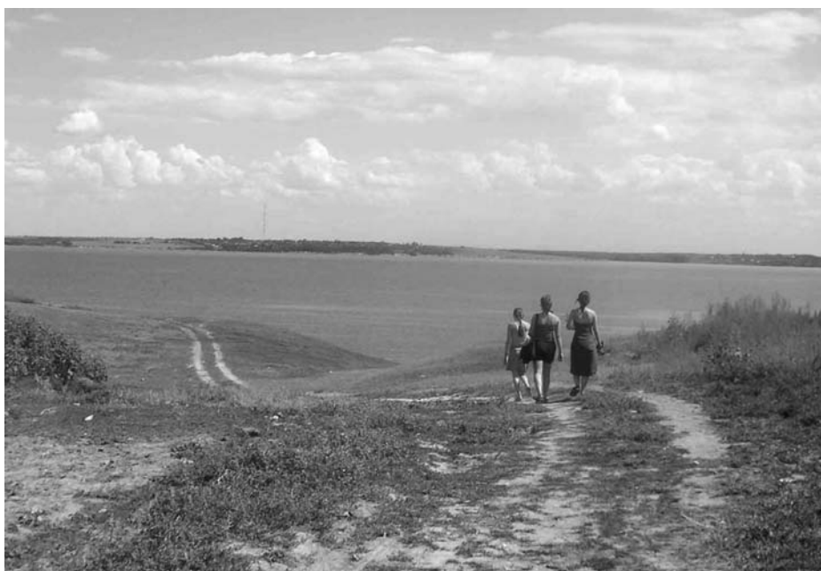
Kraja på promenad ned till floden Dnjepr.