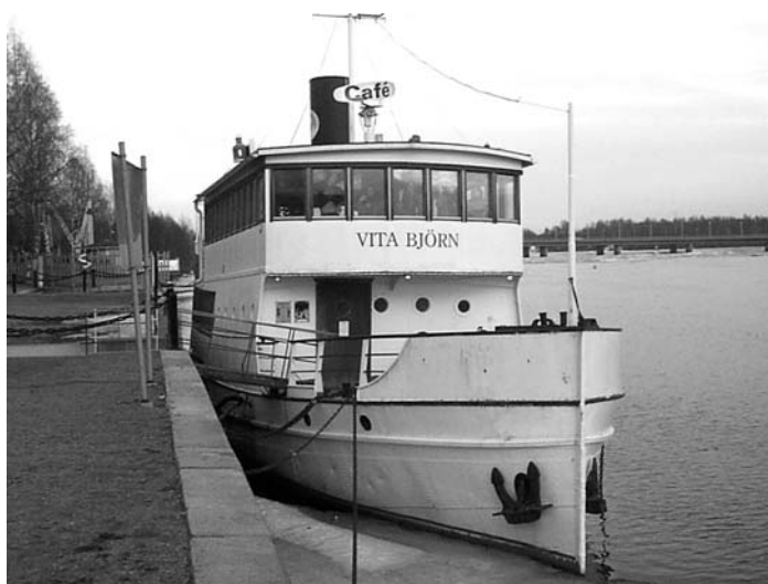
Cafébåten Vita Björn hittar man förtöjd i Umeälven närmast "Trädgård i norr". Den gungar lite extra på onsdagarna. Gott fika, en bit mat och öl/vin kan njutas till musiken.

Båten fortsätter att bjuda på folkmusik på onsdagskvällarna hela terminen, men programmet är inte fastställt längre än till den 15 oktober. Aktuell info finns på föreningens hemsida www.umeafolkmusik.se