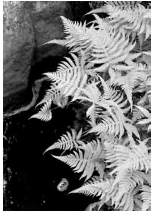
Ombunkar vid en bäck i Ratan