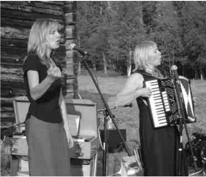
Bilderna är från föreställningen som gavs i Rismyrliden utanför Boliden