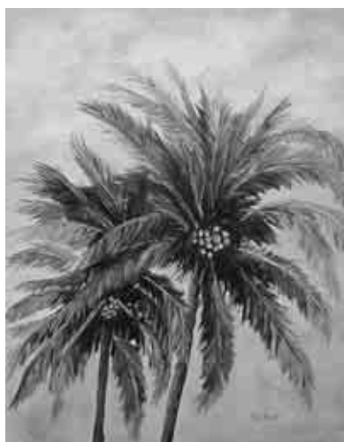
2004-års Gammliafest förbereddes under palmsus i Gambia... Målning av Ricky Martin, funnet på nätet.