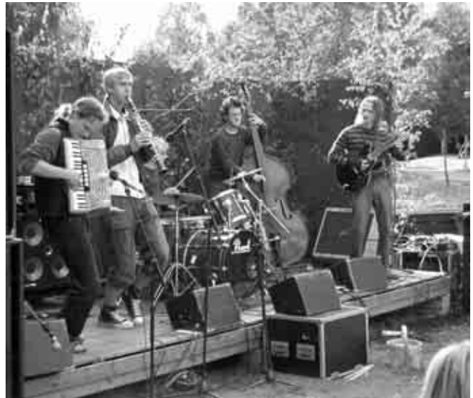
Ovan: AksakOrkestar, Balkan-ös från Stockholm. Jag hoppas att få se och höra dessa unga talanger igen!